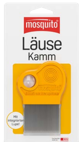
Läusekamm mit integrierter Lupe PZN 01873902