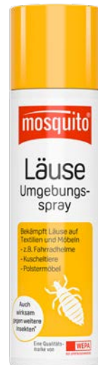
Läuse- Umgebungsspray** 150 ml PZN 15434684