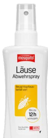
Läuse- Abwehrspray** 100 ml PZN 10834982